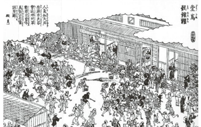
堂島米市場立ち合いの風景 (『摂津名所図会』から)

本講演では、主として、このような数量経済史の方法による江戸時代経済史の新動向をとくに最も着実に研究が進んだ物価史と人口史に焦点を絞って、お話ししたいと思います。