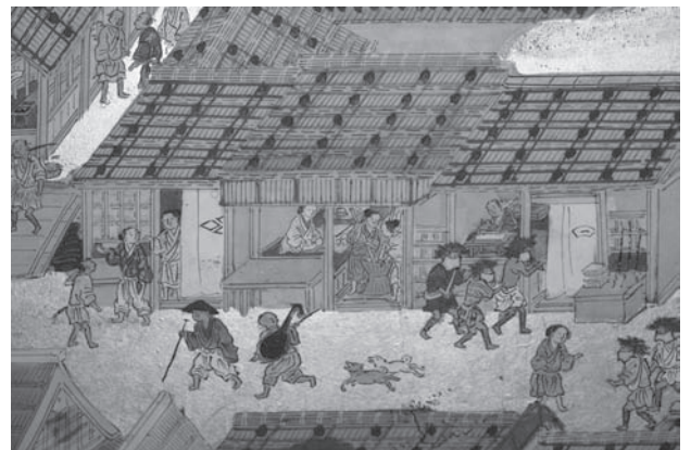
小川通りの歳末風景(上杉本より)

本講演では、洛中洛外の歴史に触れたのち、上杉本の細部をご覧いただきながら、当時の人々の生活の様子をご紹介しますと思います。