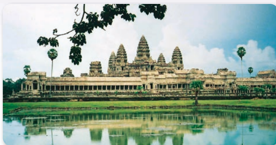
アンコール・ワット遺跡