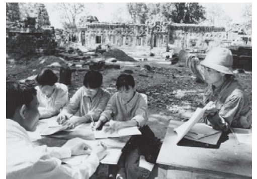
アンコール・ワットでの講義風景

上智大学アンコール遺跡国際調査団(以下調査団)は、国際交流の哲学に「カンボジア人による、カンボジアのための、カンボジアの遺跡保存修復」を掲げ、1980年以来カンボジア王国政府と協力し、中・長期計画に基づく自前発掘・自前修復・自国研究ができるカンボジア人専門家の人材養成を目標としてきた。2008年8月にも調査団を派遣した。調査団の主な活動分野はカンボジア側の遺跡公園アプサラと協力して、建築、地質、考古、水利環境、森林、村落社会、民話・伝統文化、遠隔地遺跡などである。～