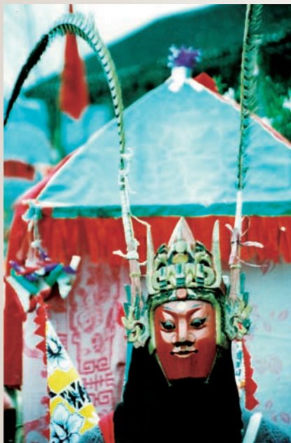
中国貴州の仮面劇「地戯」の仮面

この講演では、京劇をはじめとする中国各地のさまざまな演劇、特に珍しい仮面劇について紹介し、中国の演劇と日本の歌舞伎や能との類似点、相違点、さらにそれらが歴史的にどのような関係にあったのかについてお話したいと思います。古代以来、日本の文化は中国からさまざまな影響を受けてきましたが、日本独自の文化と思われる歌舞伎や能にも中国の影響があることを知っていただき、日中文化交流についての理解を深めていただければ幸いです。講演ではビデオをご覧ください、実際に中国の演劇を目と耳で楽しんでいただきたいと思います。