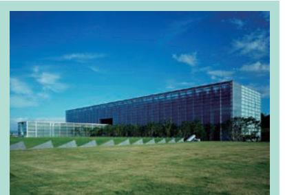
国立国会図書館関西館

※国立国会図書館関西館のご協力により、同館所蔵資料の中から、講演テーマに関連する資料展示を行います。