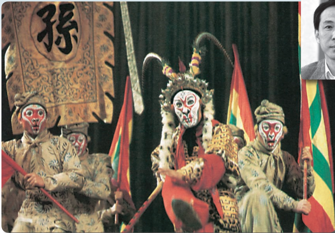
京劇『西遊記』の孫悟空「京劇臉譜」(江蘇人民出版社 1987)

日時 2010年5月22日(土) 講師 金文京氏 14:00～16:00(開場:13:30) (京都大学人文科学研究所 教授)