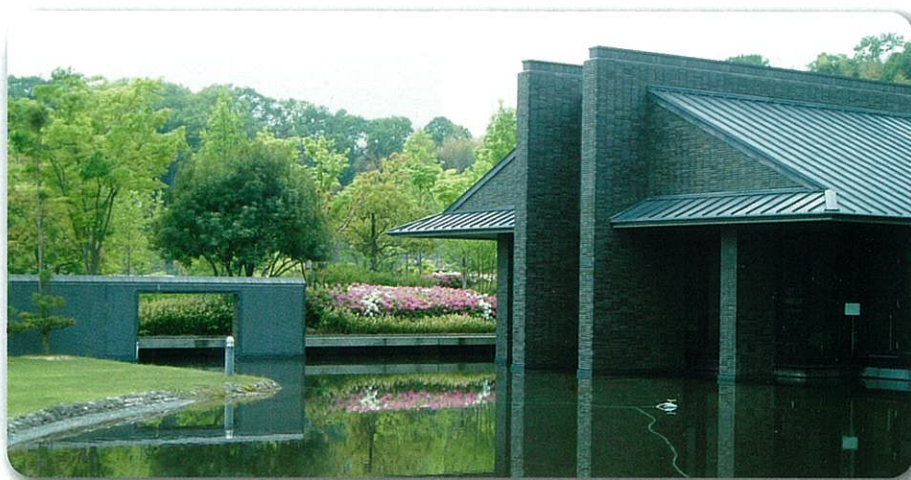
高等研の研究施設