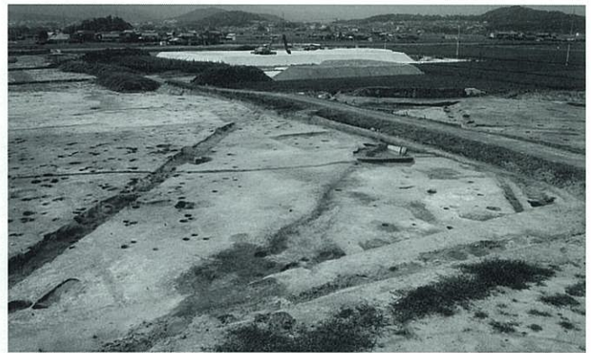
関津遺跡の道路跡