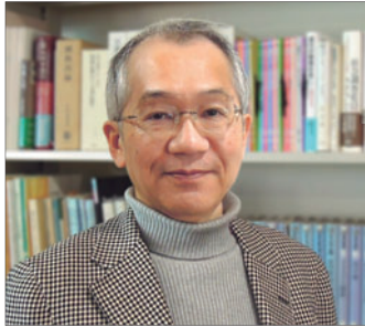
橋爪 大三郎 社会学者、 東京工業大学名誉教授

執筆活動を経て、東京工業大学教授(～2013)。専門は、理論社会学、比較宗教論など。著書に『げんきな日本論』、『戦争の社会学』、『ふしぎなキリスト教』、『面白くて眠れなくなる社会学』、『世界がわかる宗教社会学入門』、『はじめての構造主義』など。