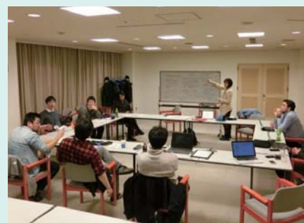
グループミーティングの様子

なお、本年度の研究は、国際高等研究所のプロジェクト以外に、科学研究費補助金(挑戦的萌芽研究)「人工知能の規範・倫理・制度に関する対話基盤と価値観の創出」(平成27年度-28年度)、国立情報学研究所・公募型共同研究「情報と社会の系譜学」(平成27年度)によって実施されてきた。国際高等研究所に採択されたのは7月以降であるため、それ以前の活動についてはAIR Newsletter vol.2 (1)を参照されたい。